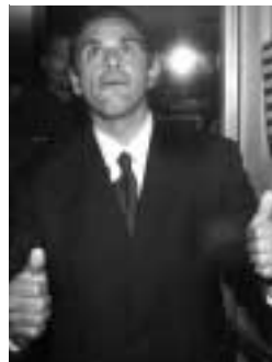
Il candidato ispanico Antonio Villaraigosa

all'insegna della correttezza e misurato a pieno il monumentale potenziale elettorale di Villaraigosa, che aveva raccolto il 30 per cento dei voti, James Hahn ha schierato la cavalleria cominciando ad andare giù duro. Prima uno spot televisivo dove si associava l'immagine di Villaraigosa allo spaccio e al consumo di cocaina. Poi un altro dove i proclami di Tonio fungevano addirittura da audio ad un servizio con immagini sfumate su pipe di crack e partite di eriona. Il tutto con una voce ammonitrice: «Los Angeles non può fidarsi di Antonio Villaraigosa». Il colpo basso («che è una vigliaccheria e come tale non si commenta») furono le parole di Villaraigosa) si riferiva ad