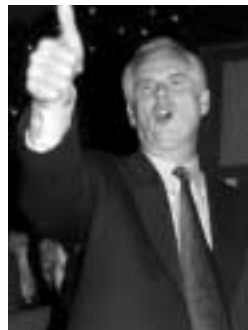
James Hahn, sindaco di Los Angeles

Non ci sarà il primo "major" latino nella seconda città Usa. Ha vinto James Hahn, un democratico illuminato che ha avuto l'appoggio decisivo della comunità afroamericana e che ha denigrato il rivale accusandolo di droga